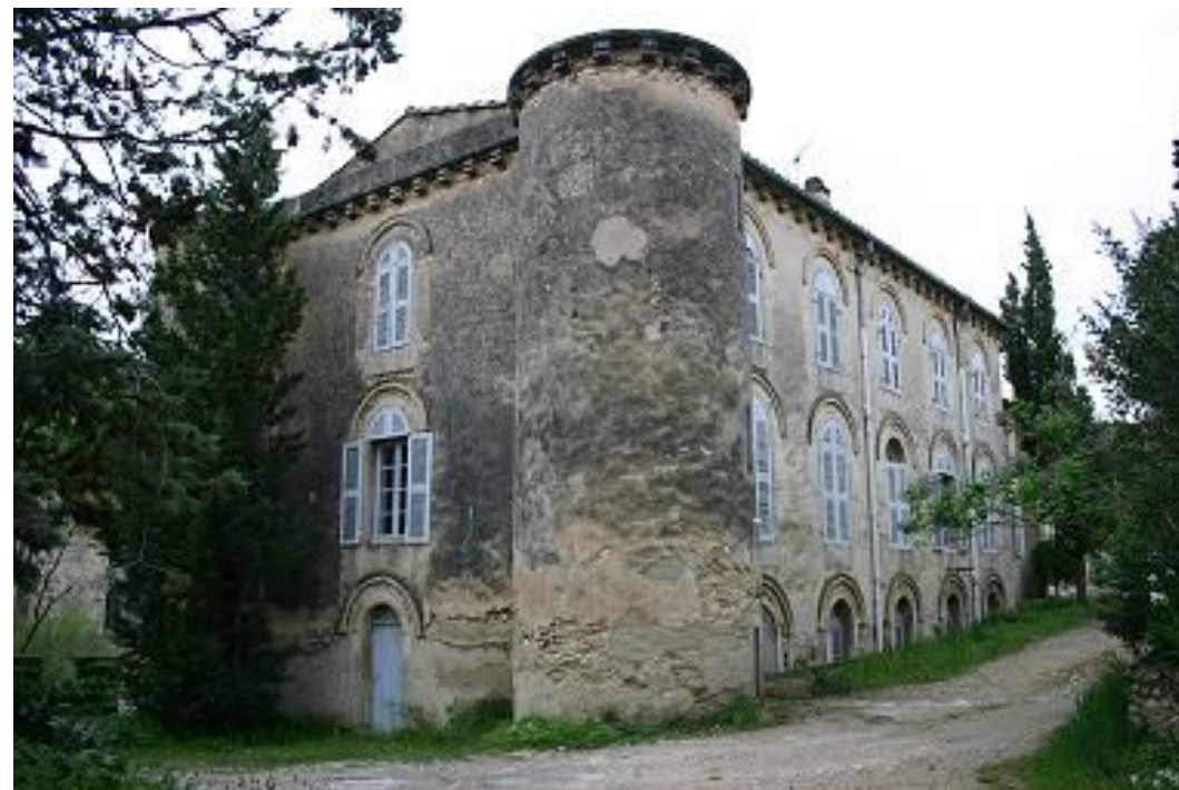
Bâtiment dit « Des Pères », angle Nord /Est du corps de bâti XIXe siècle