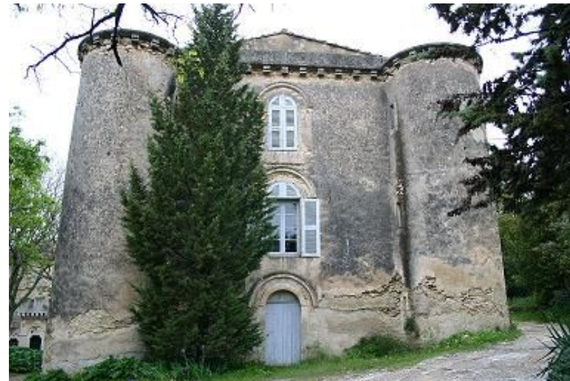
Façade Est du corps de bâti XIXe siècle

Créée par la loi du 2 juillet 1996 et reconnue d'utilité publique, la Fondation du Patrimoine est le premier organisme national privé indépendant qui vise à promouvoir la conservation et la mise en valeur du patrimoine de nos régions.