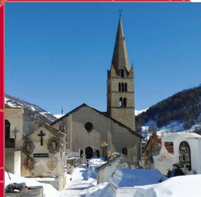
Église St Jean-Baptiste 05470 - Commune d'Aiguilles

SOYONS ACTEURS DE LA SAUVEGARDE DE NOTRE PATRIMOINE