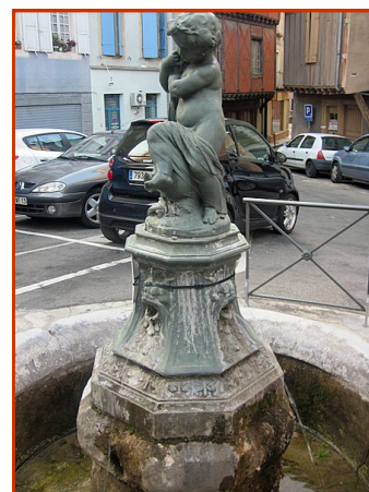
A gauche : fontaine de Montaut avant le vol . A droite, fontaine de Foix.