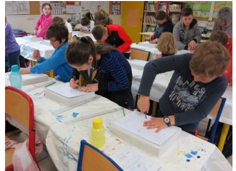
Les élèves de CM1 réalisant une méridienne

Grâce au travail mené au long de l'année, les élèves ont ainsi été sensibilisés à la notion de patrimoine. Le concours aura offert à cette classe une forte cohésion de groupe et le sens de l'initiative. Et qui sait, peut-être des vocations futures au métier de gnomoniste?