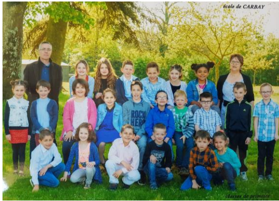
Les élèves de CM1 lauréats du Grand Prix 2018

L'étude de l'ensemble campanaire les a conduits à enquêter sur la famille qui avait offert la cloche au XIX ème siècle. Tantôt historiens, généalogistes ou enquêteurs, les CM1 ont su remonter le temps et apprendre l'histoire à travers les histoires personnelles des membres de cette famille. La rencontre d'artisans, l'étude d'archives anciennes, l'excellent travail pédagogique de