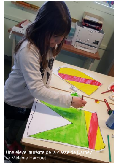
Une élève lauréate de la classe de Darney