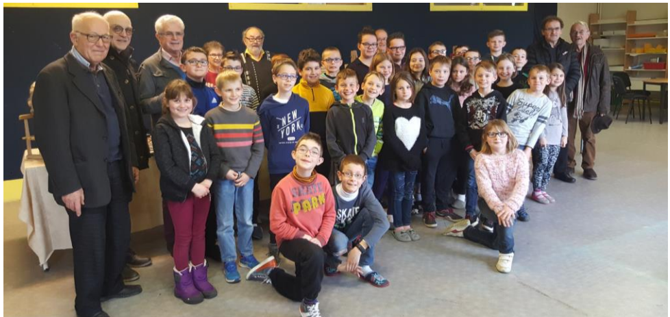
Les élèves de CM1 de Darney

MENTION HISTOIRE & PATRIMOINE (DOTÉE DE 5 000 €) L'ÉCOLE DE DARNEY (88) POUR SON PROJET DE RESTAURATION DES GEÔLES DU CHÂTEAU DE DARNEY