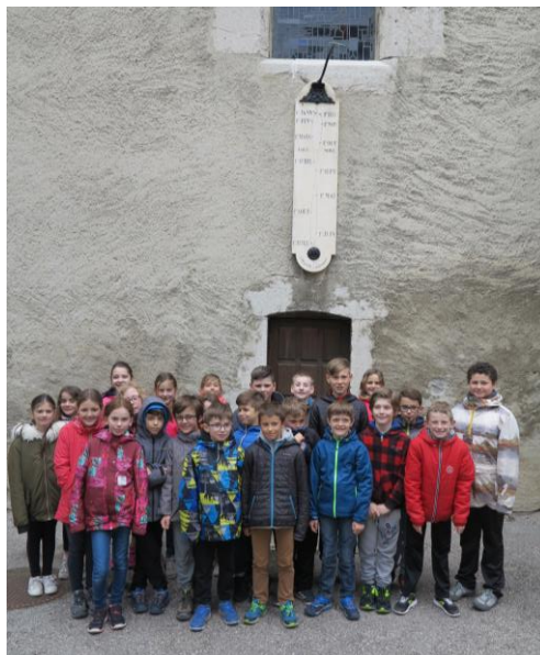
Les élèves de CM1 devant la méridienne à restaurer

Sur l'un des côtés de l'église de Monestier-de-Clermont, on peut voir un drôle d'instrument : une méridienne de Chavin. Cet objet, en plus d'aiguiser la curiosité, indique l'heure à qui sait la lire. Chose aisée désormais pour les élèves de CM1 de Sylvie Sibut qui ont travaillé toute l'année sur cet élément de patrimoine insolite! Il n'existe plus qu'une quinzaine de méridiennes de Chavin aujourd'hui en Isère.