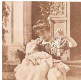
Misia sur le perron du Relais, photo A. Natanson, 1899.

18 rue de Paris 78460 CHEVREUSE Mail : f.houze@laposte.net