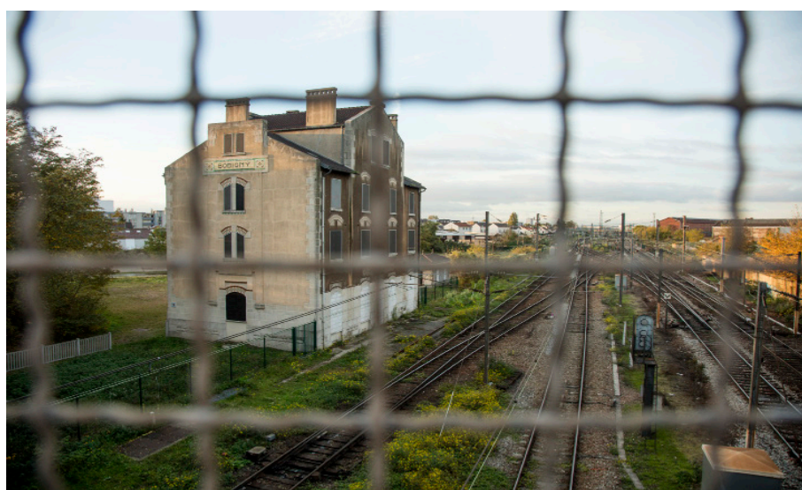
Gare de déportation de Bobigny

Sous l'égide de la Fondation du patrimoine, la Ville de Bobigny lance samedi 17 septembre 2016 une campagne de mobilisation du mécénat populaire pour soutenir son projet d'aménagement paysager et scénographique de la gare de déportation, consacrée « lieu de mémoire » en 2005 et inscrite à l'inventaire supplémentaire des monuments historiques. La gare de Bobigny représente un lieu de mémoire de la déportation des plus symboliques. Les pavés foulés par les derniers pas des déportés juifs sur le sol français, aujourd'hui enfouis sous une peau de bitume, vont être remis au jour et restaurés dans leur état initial.