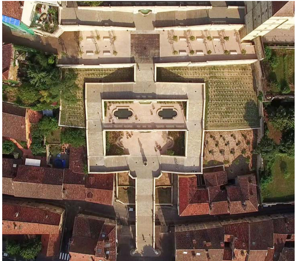
Escalier monumental d'Auch