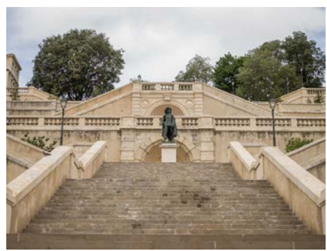
Escalier monumental après restauration

Grâce au mécénat de la Fondation Total, la Fondation du patrimoine s'est engagée depuis 2009 aux côtés de la Ville d'Auch en faveur de la restauration de son escalier monumental à double révolution. Les deux partenaires ont apporté un soutien de 270 000 € à la réhabilitation de cet élément incontournable du patrimoine local. En parallèle, la Fondation du patrimoine a lancé une souscription faisant appel à la générosité publique qui a permis de collecter 54 000 €.