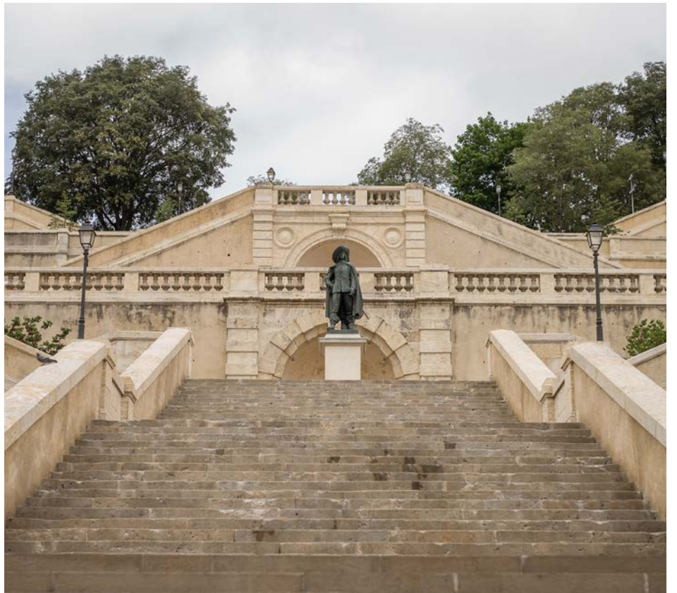
Escalier monumental d'Auch