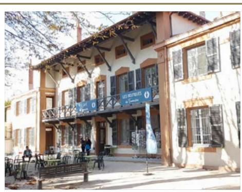
Maison des chapelains APRÈS travaux