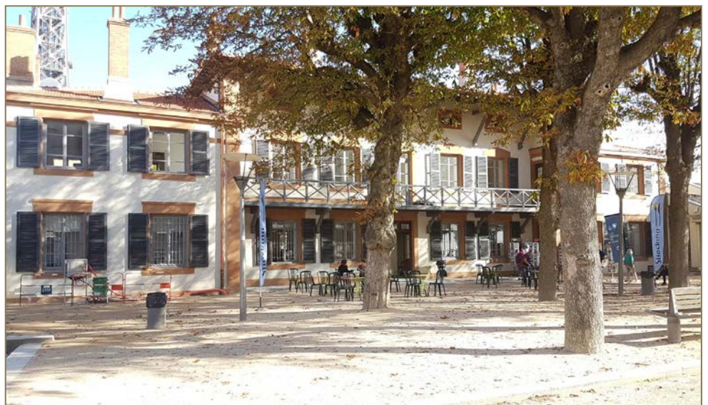
Maison des chapelains après travaux