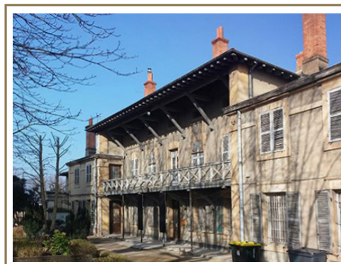
Maison des chapelains AVANT travaux

Mardi 7 novembre 2017 à 11h Esplanade de Fourvière – 69005 Lyon