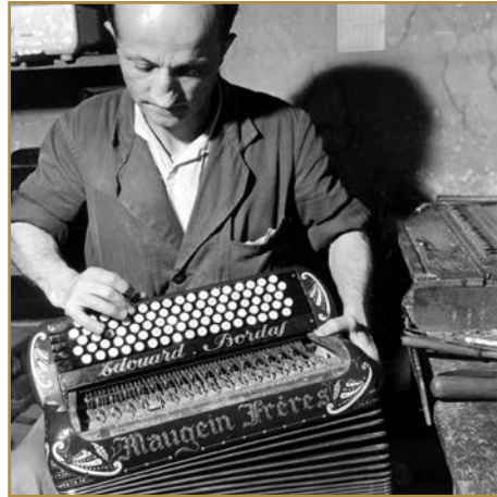
La fabrication à l'usine Mauguin à Tulle dans les années 1950

3000 m 2 . C'est à partir de cette date que l'outil industriel devient unique en son genre, par son extension, la modernisation de la production et la conception de nouvelles machines visant l'excellence en matière de précision. Plus de 200 ouvriers apportent leurs connaissances et tels des compagnons, ils sont fiers de signer de leur nom les différentes interventions ou pièces qu'ils réalisent. Ce savoir-faire unique favorise le développement de la Manufacture, fonde sa réputation mondiale et la place parmi les premiers fabricants de « piano à bretelles ».