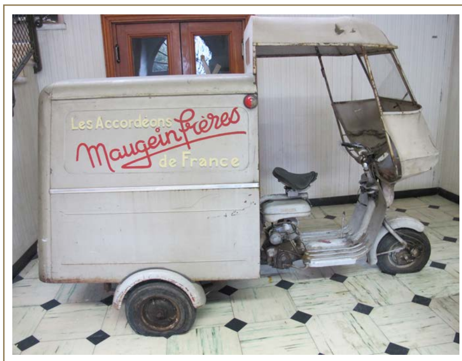
Triporteur Maugein Frères, lauréat du Prix National Moto 2017

facebook.com/fondation.patrimoine @fond_patrimoine @fondationdupatrimoine