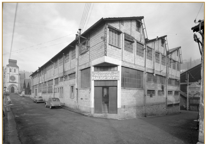
L'usine Maugein Frères à Tulle dans les années 1950

Dès 1923, dans le contexte des bals musettes qui se développent, l'entreprise prend son essor et fait construire une usine de 700 m 2 . La production des accordéons diatoniques est bientôt délaissée au profit d'une production en série d'accordéons chromatiques.