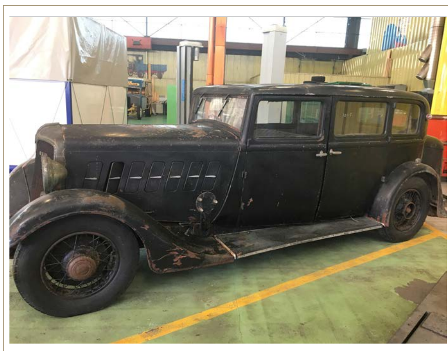
Berliet VRD 19 1933 après montage sur roues

facebook.com/fondation.patrimoine @fond_patrimoine @fondationdupatrimoine