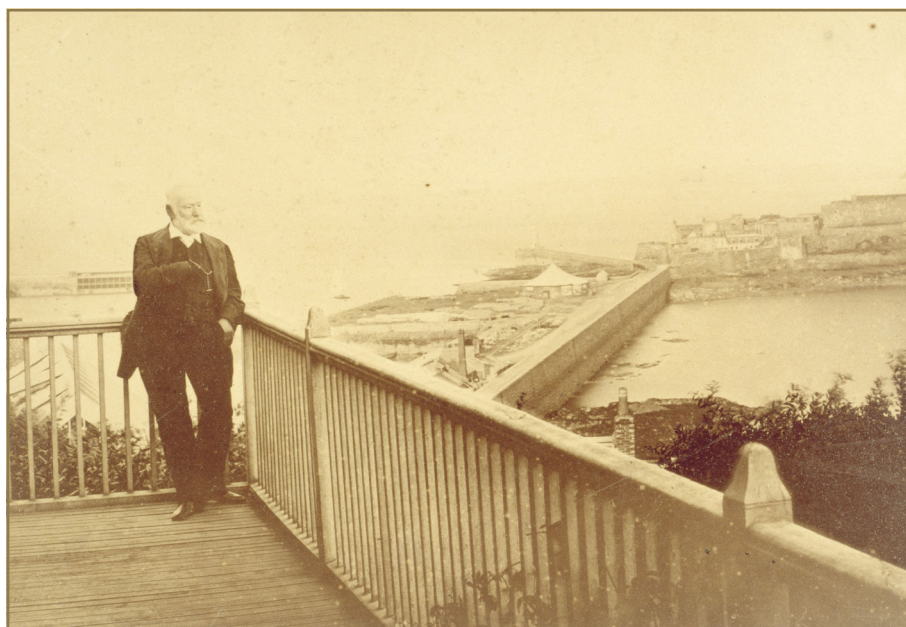
Victor Hugo sur le balcon de Hauteville House en 1878