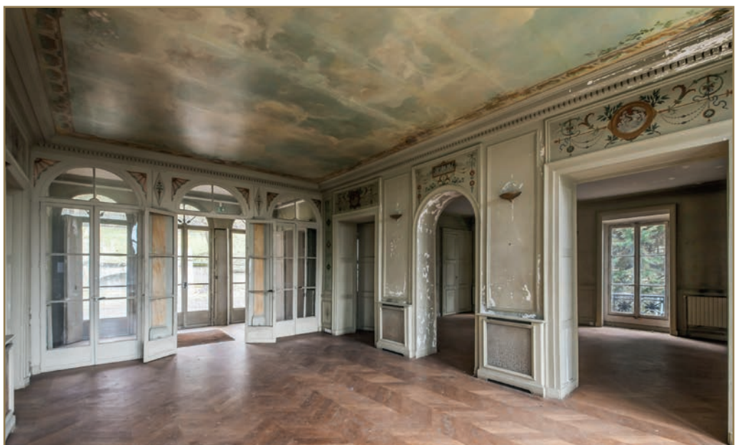
Salons du rez-de-chaussée