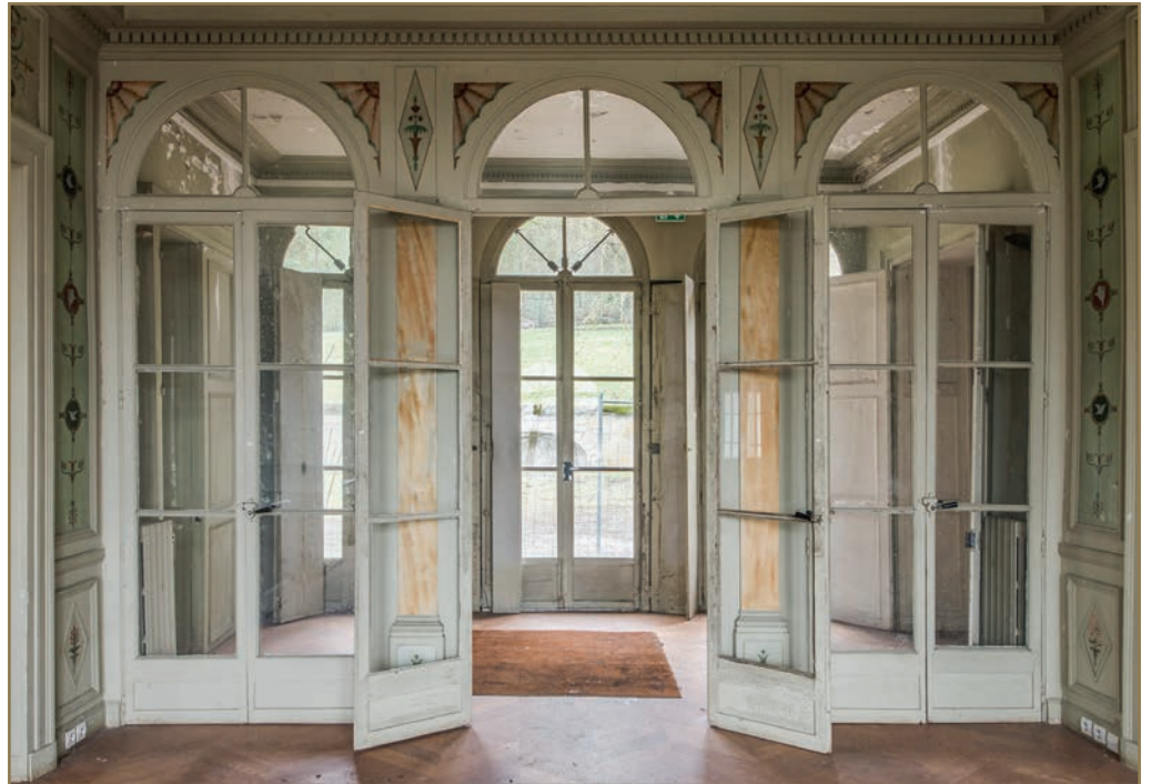
Salons du rez-de-chaussée