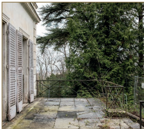
Vue de la terrasse de la Villa Viardot