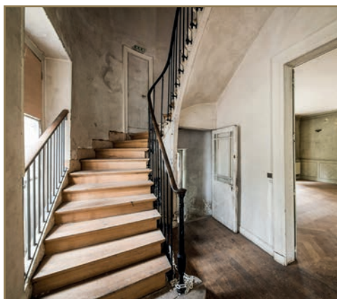
Vue de l'escalier intérieur de la Villa Viardot