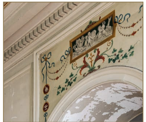
Détail de décor peint dans les salons de la Villa Viardot