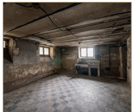
Aperçu des sous-sol de la Villa Viardot