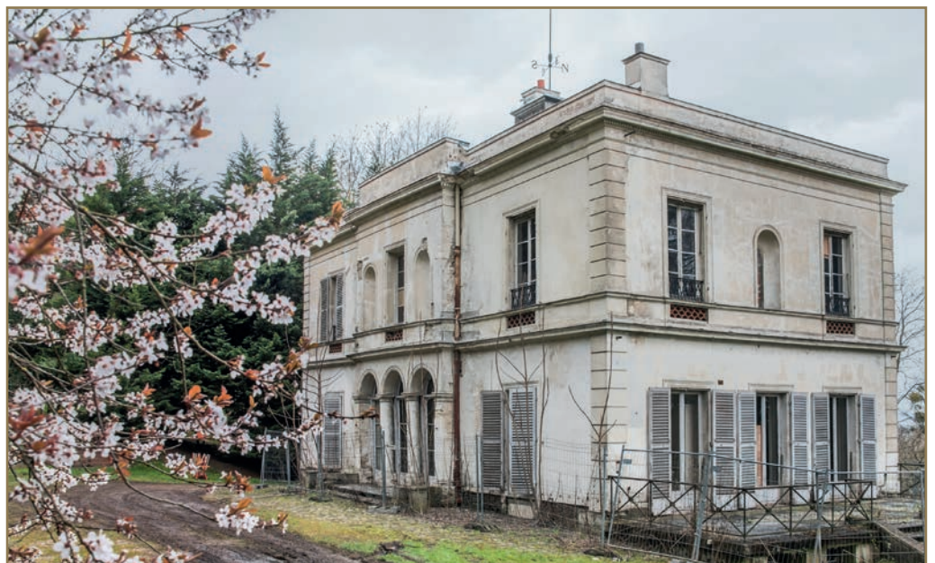
Façade extérieure de la villa Viardot

et porteur des valeurs humanistes emblématiques de la culture européenne. Ancré dans une des périodes artistiques les plus fécondes de l'histoire de l'art, le CEM sera à la fois un lieu de patrimoine célébrant les artistes de l'époque romantique mais également une académie musicale accueillant de jeunes artistes en formation, un pont entre les XIXe et XXIe siècles. Son objectif est de s'affirmer dès son inauguration comme un lieu transversal de référence et d'étude sur la musique, ouvert également à d'autres disciplines (littérature, arts visuels, histoire, philosophie, théâtre...). Lieu de transmission, de résidence et d'échange, il a vocation à devenir également un centre de recherche sur les neurosciences et plus particulièrement sur les liens entre musique et cerveau. Il prévoit ainsi d'inviter régulièrement des neuroscientifiques travaillant notamment sur le rôle moteur particulièrement puissant que la musique peut jouer dans l'assimilation des connaissances générales et dans le traitement de certaines pathologies telles que l'autisme.