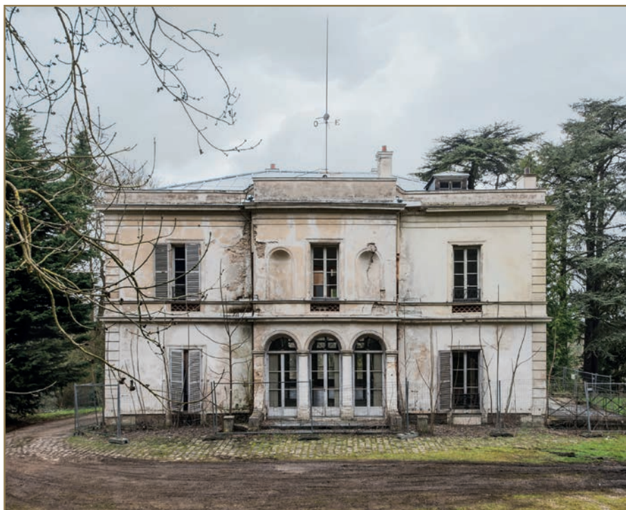
Villa Viardot à Bougival

FONDATION DU PATRIMOINE Directrice presse et presse événementielle Laurence Lévy Téléphone 06 37 84 67 26 Mail laurence.levy@fondation-patrimoine.org Adresse 153 bis, avenue Charles de Gaulle 92200 Neuilly Site www.fondation-patrimoine.org