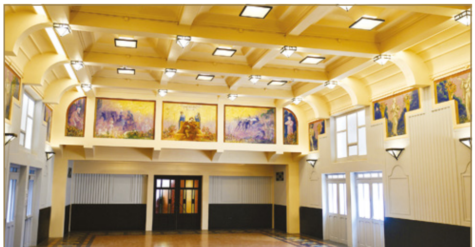
La salle de musique

Le plafond est couvert d'une voûte en berceau à caissons au centre de laquelle se trouve une verrière en forme d'ellipse. Les parois nord et sud sont décorées de deux peintures monumentales, réalisées par Jean Lafitte.