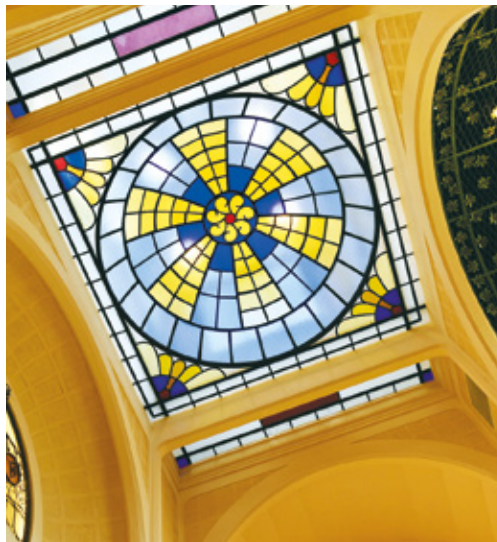
Coupole en verre coloré © Olivier Noirfalise