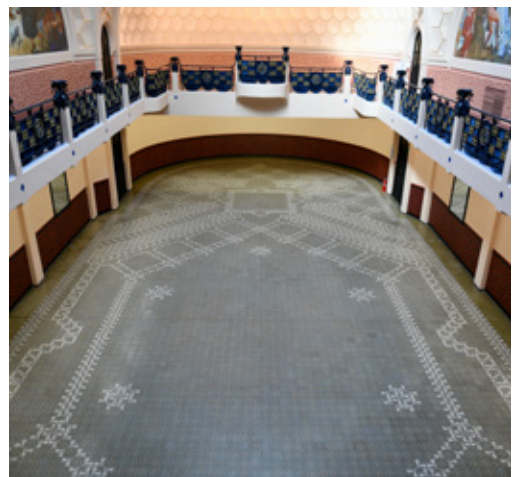
La salle de bal