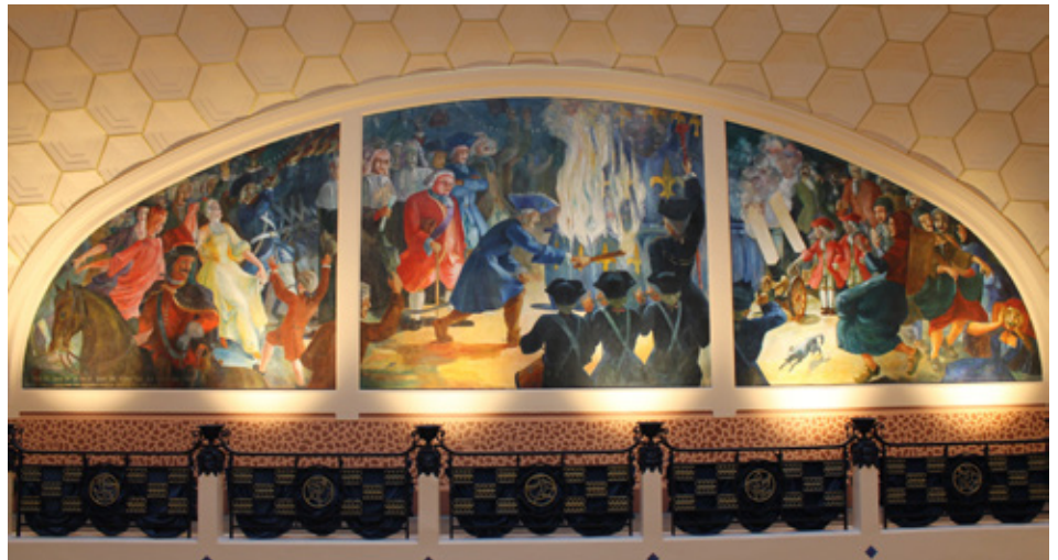
Peintures murales dans la salle de bal © Fondation du patrimoine