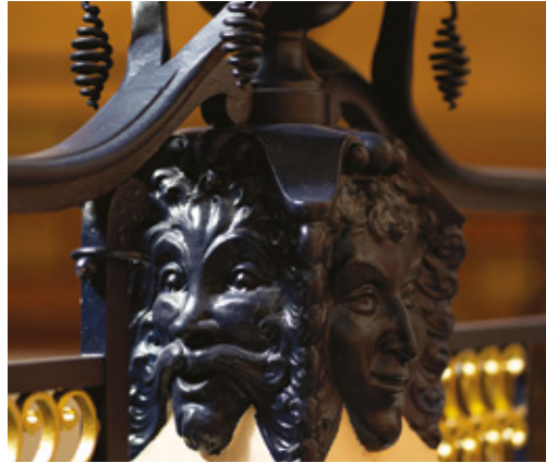
Détail d'une décoration en ferronnerie

Spécificité de cette salle, les décorations en fer forgé, qui sont pléthore de la porte d'entrée à la salle de bal, en passant par les escaliers, les grilles d'aération et de chauffage, ont été entièrement réalisées dans les ateliers des entreprises locales longtemps spécialisées dans la métallurgie.