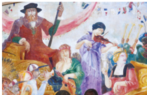
Détail d'une peinture de la salle de bal