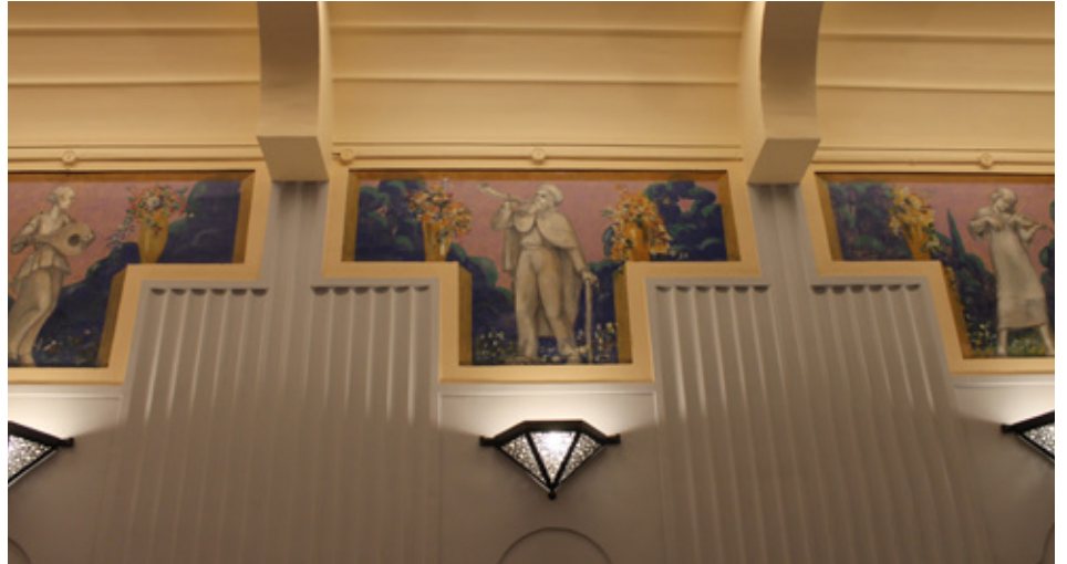
Peintures murales dans la salle de musique

En plus d'être partie intégrante de la décoration, elles ont pour fonction, comme tous les éléments décoratifs, d'indiquer l'affectation de la salle où elles se trouvent. Dans la salle de musique, elles illustrent des scènes musicales, instrumentistes ou collectives. Dans la salle de bal, elles prennent une dimension historique et représentent des moments festifs de la cité.