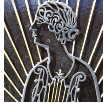
Détail d'une ferronnerie de la porte d'entrée