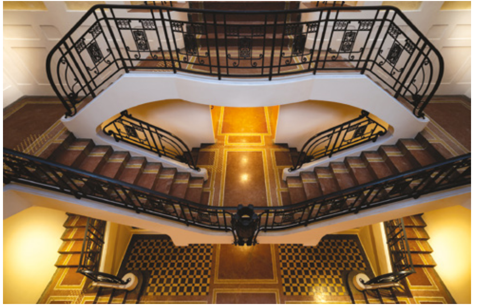
Escalier monumental